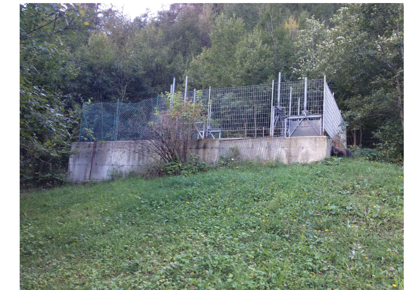
F2 - Vasca esistente, prospetto est