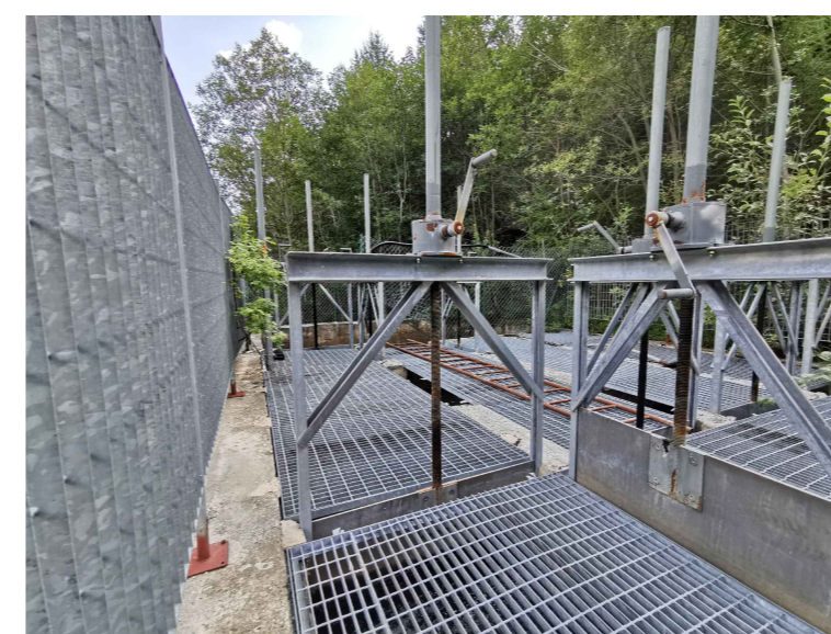
F4 - Vasca esistente, dissabbiatore