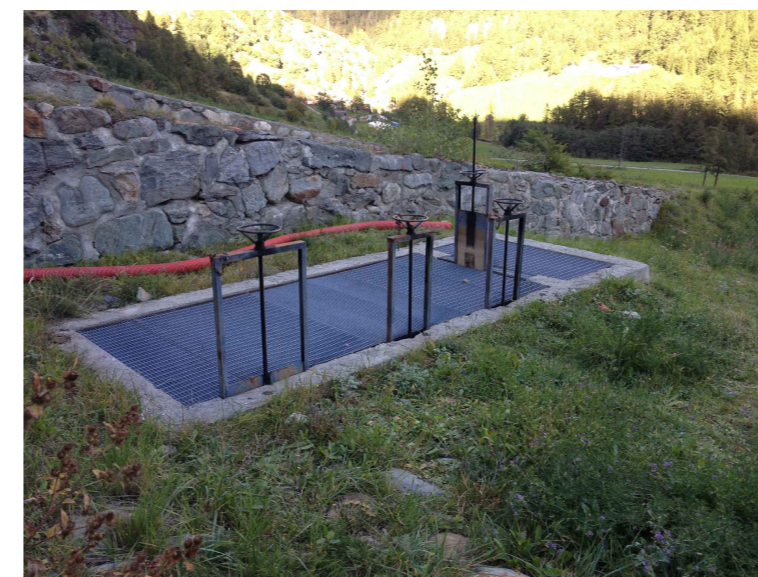
F5 - Pozzetto esistente