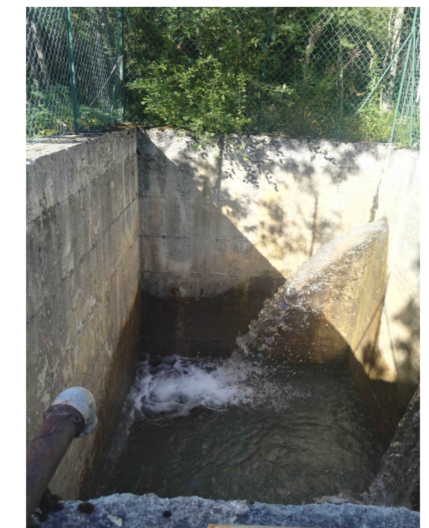
F3 - Vasca esistente, vasca di carico