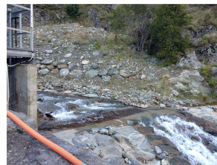
F6 - Presa del CMF