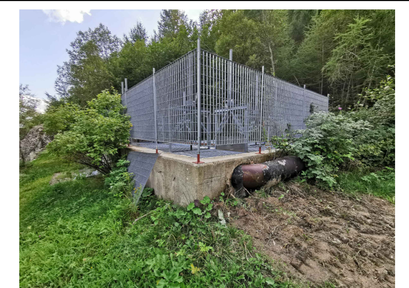
F1 - Vasca esistente, ingresso condotta